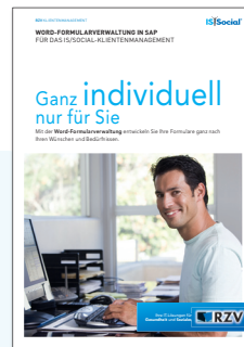
PRODUKTINFORMATION WORD-FORMULAR-VERWALTUNG IN SAP für das IS/Social-Klientenmanagement