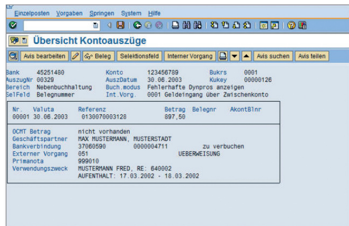
Detailansicht einer Kontoauszugsposition

Beim elektronischen Kontoauszug der RZV GmbH wurden die Suchmuster entscheidend erweitert: Neben der Rechnungsnummer findet ein Abgleich der Fall- oder Bewohnernummer, der absendenden Bankverbindung, der Sammelrechnungsnummer, der Kundennummer und des Patienten-/Bewohnernamens statt.