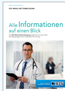
PRODUKTINFORMATION RZV-MODUL BETTENBELEGUNG