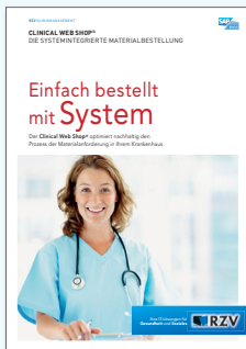
PRODUKTINFORMATION CLINICAL WEB SHOP®