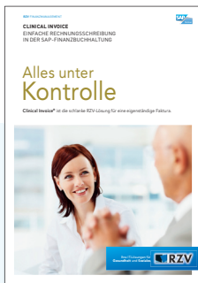
PRODUKTINFORMATION CLINICAL INVOICE – Einfache Rechnungsschreibung in der SAP-Finanzbuchhaltung