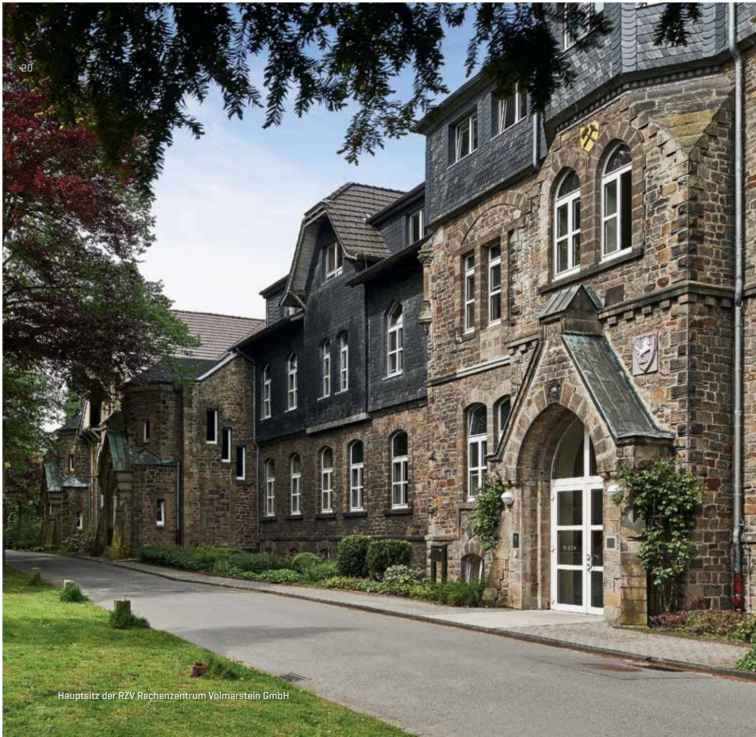
Hauptsitz der RZV Rechenzentrum Volmarstein GmbH